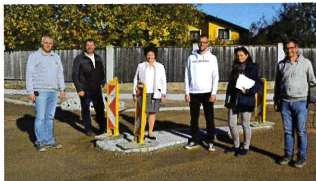
Gföhl – Feldgasse

Im Frühjahr 2023 werden je nach Witterung in einem zweiten Abschnitt die Verlegung des Regenwasserkanals mit den erforderlichen Hausanschlüssen sowie der Kabelbau und der Straßenbau fortgesetzt.